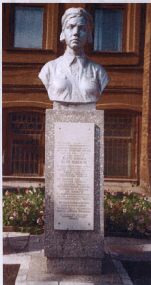
Памятник Вале Березовской на территории Слюдяной фабрики

В СООТВЕТСТВИИ С ПРОГРАММОЙ ТРЕСТОМ «СОЮЗСЛЮДА» БЫЛ СОСТАВЛЕН И 19 АПРЕЛЯ 1933 Г. УТВЕРЖДЕН ГЛАВКОМ ПРОЕКТ СТРОИТЕЛЬСТВА ИРКУТСКОЙ СЛЮДЯНОЙ ФАБРИКИ НА СУММУ 3 МЛН 200 ТЫС. РУБ. ФАБРИКА БЫЛА ВОЗВЕДЕНА В УДАРНЫЕ СРОКИ. ТАКИМ ОБРАЗОМ, 1930-1934 ГГ. СТАЛИ ЭТАПОМ ИНТЕНСИВНОГО РАЗВИТИЯ СЛЮДЯНОЙ ПРОМЫШЛЕННОСТИ.